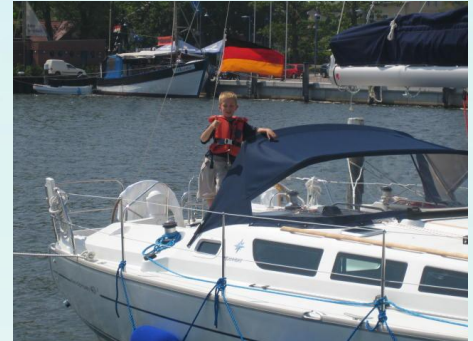
Jeanneau Sun Odyssey 40.3 "ARIES"

Ein einfaches Reffen durch Einleinen-Reffsystem mit Lazy-Jack und Lazy Bag ist möglich. Es gibt ein Rollrefsystem am Vorsegel. 2 Ruder im Heck ermöglichen ein entspanntes Segeln. 4 dicke Batterien geben immer genug Strom. Ein starker Motor (40 kw) gibt Sicherheit. Das Schiff verfügt über einen großen Farbkartenplotter mit GPS und eine moderne Selbststeueranlage. Ab 2008 verfügt die Yacht über einen DVBT-Fernseher mit DVD-Abspielmöglichkeit.